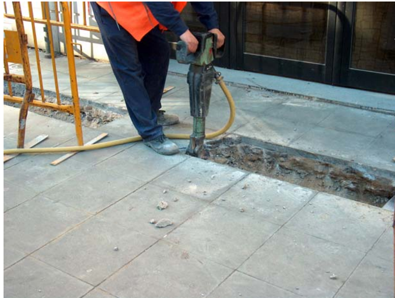
Foto 1. Obertura de la rasa amb martell pneumàtic.