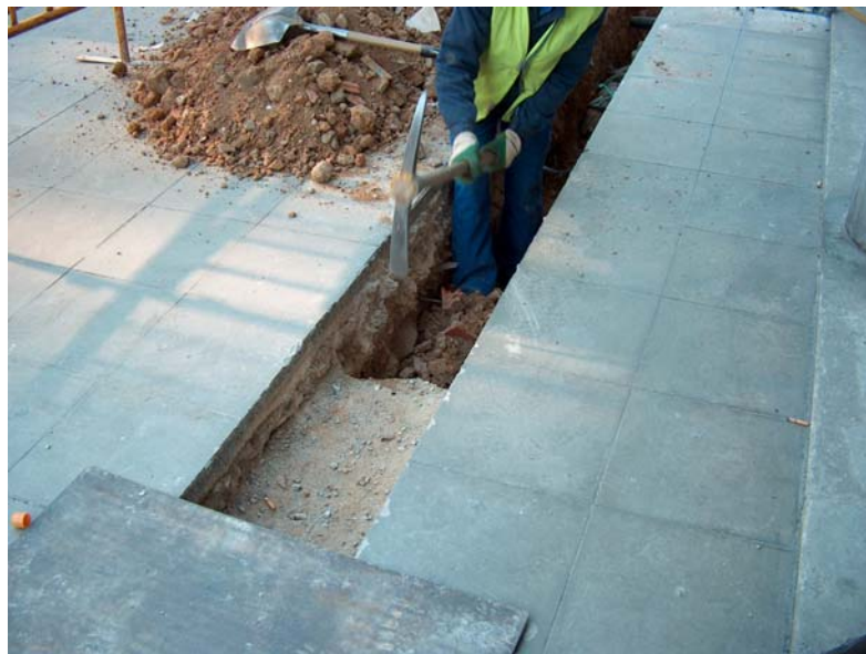
Foto 2. Obertura de la rasa a mà.