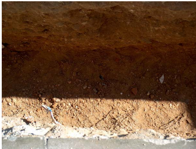
Foto 4. Part de la rasa buida.