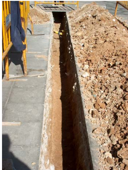
Foto 3. Rasa buida.